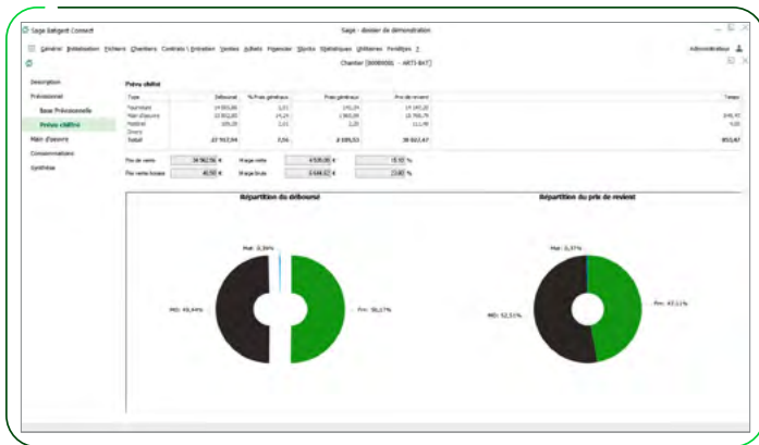
Interface chantier simplifié